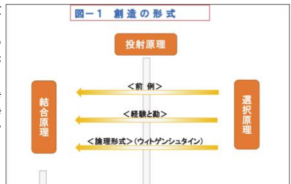
図-1では、選択原理は素材・材料の中から必要なものが取捨選択される過程をいう。単語群や構造物の部品を思えばよい。投射原理は素材・材料を変形・加工し製品をうみだす一種のフィルターである。誤解の場合、アンカー効果、後光効果、先行刺激効果、などが投射原理で、正しい理解を歪曲するフィルターである。システム1の世界である。システム2が歪曲作用に歯止めをかけるのはこの投射原理の土俵である。歪められた結果は結合原理になっており“誤解”という製品である。誤解に限らず、あらゆる心理現象がこの「創造の形式」に則っているのではないか。アンカー効果などと異なった投射原理が作用すれば、結論として得られる感想や行動も異なってくる。誤解の場合、典型的な例がアンカー効果や後光効果であるが、ここに光を当てて特徴を調べるのが“誤解の研究”である。