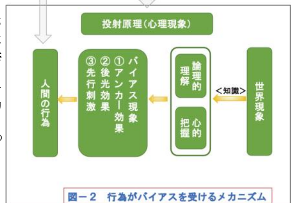
図-2 行為がバイアスを受けるメカニズム

誤解から出発して正解あるいはアイデアに至る、これほど望ましいことはないからである。この過程を“誤解分析の登山電車”に例えたらどうか。